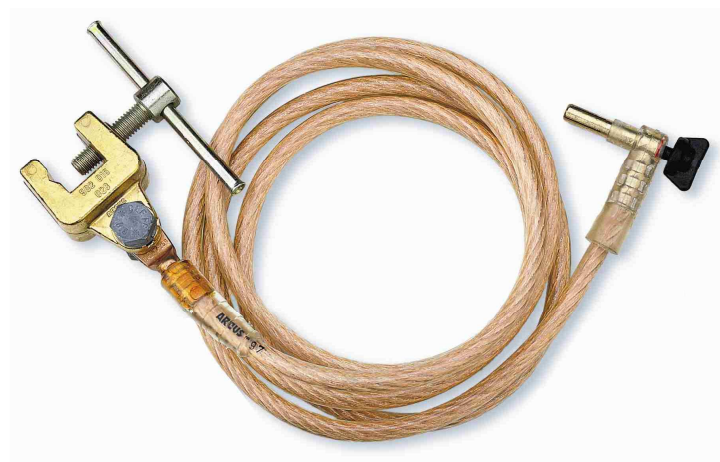
Zemnicí souprava – 2420 2