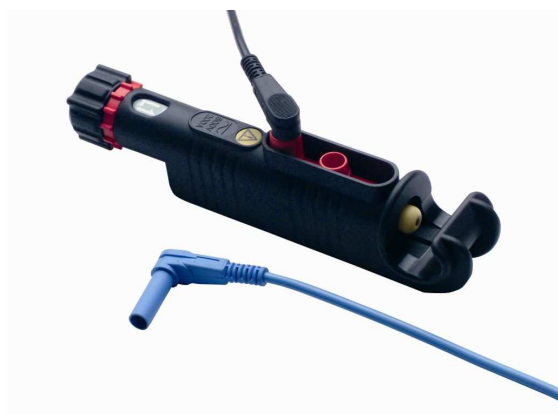
Svorka D4mm pro proudové přípojky a elektrická měření