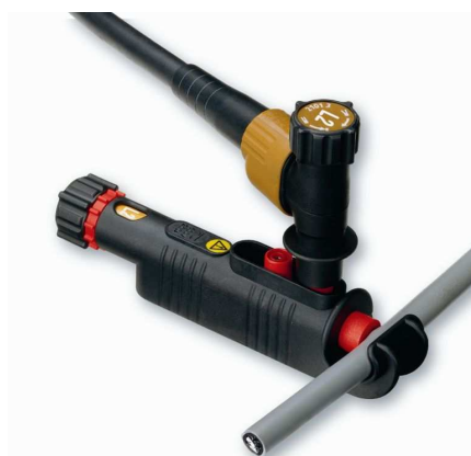
Svorka D8mm pro By-Pass soupravy a proudové přípojky.