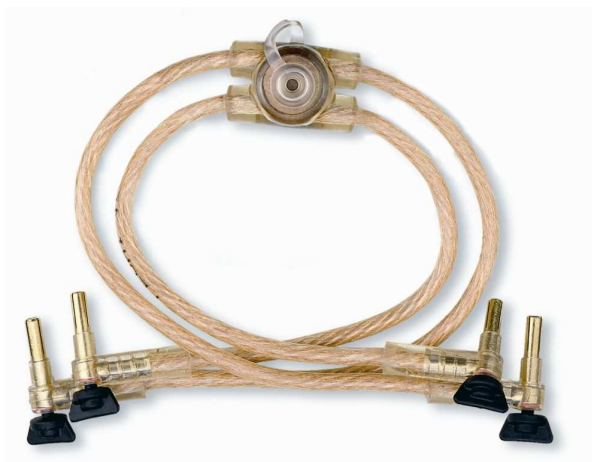
Zkratovací souprava – 2420 1